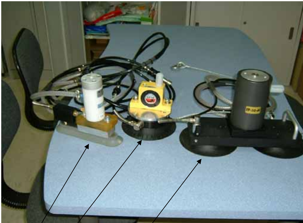
バキュームクランプVTC-15D + ビストンパイプレーターFP-50M バキュームクランプVTC-15 + タービンパイプレーターGT-16 バキュームクランプVTC-10 + ビストンパイプレーターVTL-155 (打撃用ウレタンプレート付)